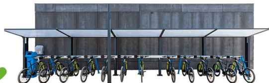
Station Mobile-Plug (Chargement automatique)