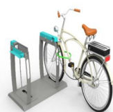
Station Juliette (Chargement manuel)